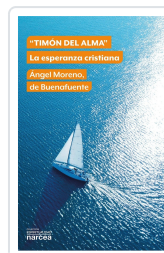
"Timón del alma" Moreno, de Buenafuente, Ángel