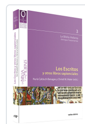
Los Escritos y otros libros sapienciales Christl M. Maier , Nuria Calduch-Benages