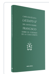
Carta encíclica "Laudato si" Santo Padre Francisco