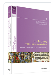
Los Escritos y otros libros sapienciales Christ M. Maier , Nuria Caldach-Benages