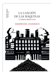
La canción de las máquinas Anderson, Sherwood