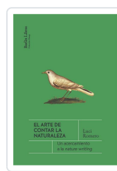
El arte de contar la naturaleza Romero, Luci