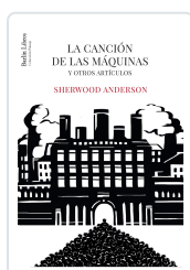
La canción de las máquinas Anderson, Sherwood