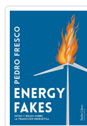
Energy fakes Fresco, Pedro