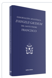
Exhortación Apostólica "Evangelii gaudium" Santo Padre Francisco