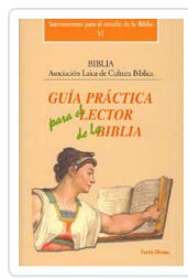
Guía práctica para el lector de la Biblia Asociación Laica de Cultura Bíblica