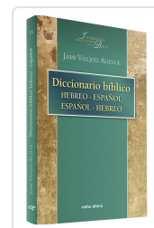
Diccionario bíblico hebreo-español / español-hebreo Jaime Vázquez Allegue