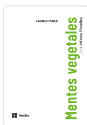
Mentes vegetales. una defensa filosófica Maher, Chauncey