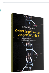
Orientar personas, despertar vidas Anselm Grün