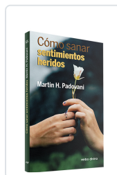
Cómo sanar sentimientos heridos Martín H. Padovani