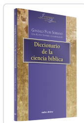
Diccionario de la ciencia bíblica Gonzalo Flor Serrano, Luis Alonso Schökel