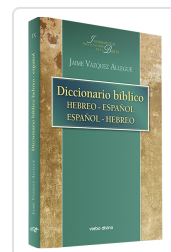
Diccionario bíblico hebreo-español / español-hebreo Jaime Vázquez Allegue