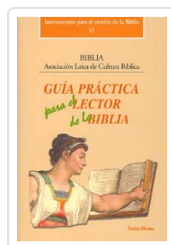
Guía práctica para el lector de la Biblia Asociación Laica de Cultura Bíblica