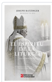
El espíritu de la liturgia Joseph Ratzinger (Benedicto XVI)