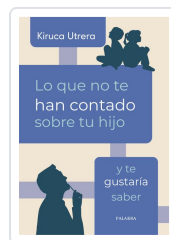
Lo que no te han contado sobre tu hijo y te gustaría saber Utrera, Kiruca