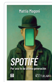
Spotifé. Por una fe de última generación