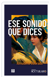
Ese sonido que dices Colorado Espinosa, Almudena