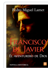
Francisco de Javier, el aventurero de Dios Lamet, Pedro Miguel