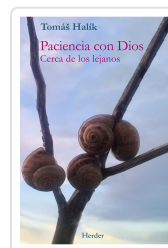
Paciencia con Dios Tomáš Halik