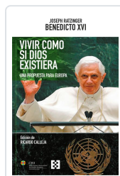
Vivir como si Dios existiera Ratzinger (Benedicto XVI), Joseph