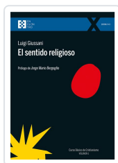
El sentido religioso Giussani, Luigi