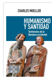
Humanismo y santidad Moeller, Charles