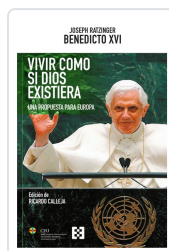
Vivir como si Dios existiera Ratzinger (Benedicto XVI), Joseph