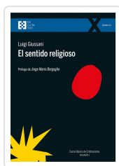
El sentido religioso Giussani, Luigi