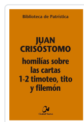
Homilias sobre las Cartas 1-2 Timoteo, Tito y Filemon Juan Crisóstomo