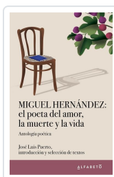
Miguel Hernández: el poeta del amor, la muerte y la vida