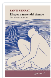
El agua a través del tiempo Serrat, Santi