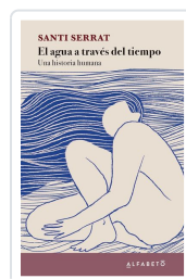
El agua a través del tiempo Serrat, Santi