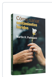
Cómo sanar sentimientos heridos Martin H. Padovani