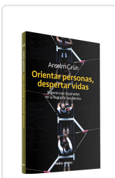
Orientar personas, despertar vidas Anselm Grün