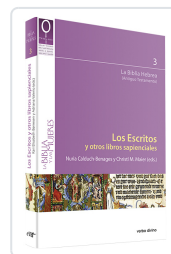
Los Escritos y otros libros sapienciales Christl M. Maier , Nuria Calduch-Benages