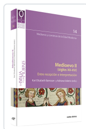
Medioevo II (siglos XII-XV): entre recepción e interpretación Adriana Valerio , Kari Elisabeth Børresen