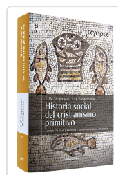
Historia social del cristianismo primitivo - CARTONE Ekkehard W. Stegemann , Wolfgang Stegemann