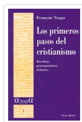
Los primeros pasos del cristianismo François Vouga