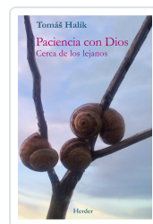
Paciencia con Dios Tomás Halik