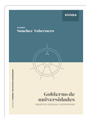
Gobierno de Universidades Sánchez-Tabernero, Alfonso