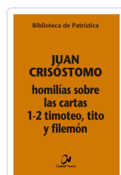
Homilias sobre las Cartas 1-2 Timoteo, Tito y Filemon Juan Crisóstomo