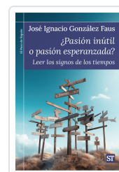
¿Pasión inútil o pasión esperanzada? González Faus, José Ignacio