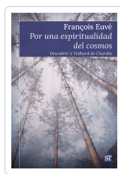
Por una espiritualidad del cosmos Euvé, François