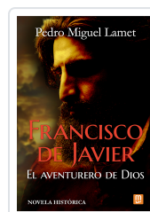
Francisco de Javier, el aventurero de Dios Lamet, Pedro Miguel