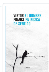
El hombre en busca de sentido Frankl, Viktor Emil