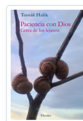
Paciencia con Dios Tomás Halik