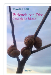
Paciencia con Dios Tomás Halik