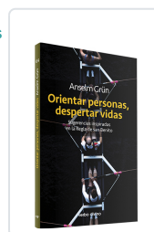
Orientar personas, despertar vidas Anselm Grün