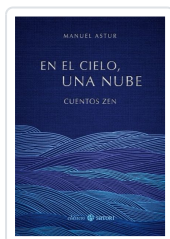
En el cielo, una nube Manuel Astur