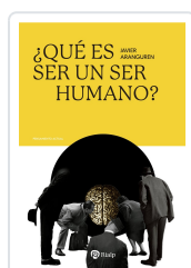
¿Qué es ser un ser humano? Aranguren Echevarría, Javier