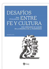
Desafíos entre fe y cultura O'Callaghan, Paul