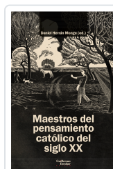
Maestros del pensamiento católico del siglo XX