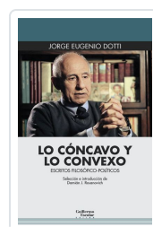
Lo cóncavo y lo convexo Dotti, Jorge Eugenio