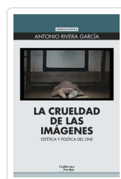
La crueldad de las imágenes Rivera García, Antonio