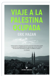
Viaje a la Palestina ocupada Hazan, Eric