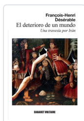
El deterioro de un mundo Désérable, François-Henri