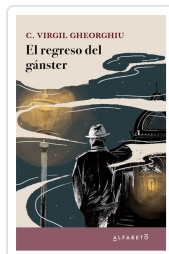
El regreso del gánster Gheorghiu, C. Virgil