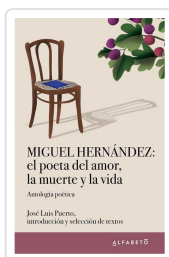
Miguel Hernández: el poeta del amor, la muerte y la vida