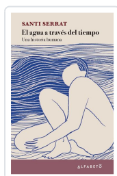
El agua a través del tiempo Serrat, Santi