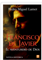
Francisco de Javier, el aventurero de Dios Lamet, Pedro Miguel