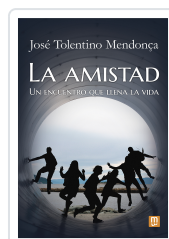
La amistad Tolentino Mendonça, José