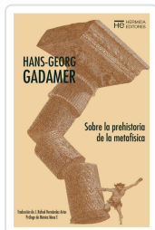
Sobre la prehistoria de la metafísica Gadamer, Hans Georg