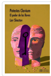
Potestas Clavium Shestov, Lev