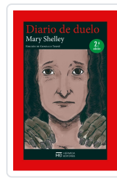
Diario de duelo (2a edición corregida) Shelley, Mary