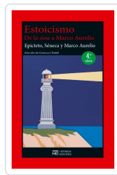
Estoicismo Aurelio, Marco; Séneca, Lucio Anneo; Epicteto