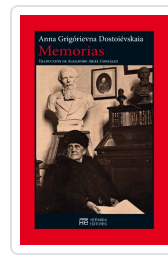
Memorias Dostoiévskia, Anna Grigórievna