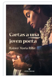
Cartas a una joven poeta Maria Rilke, Rainer