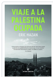
Viaje a la Palestina ocupada Hazan, Eric