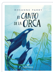
El canto de la orca Parry, Rosanne