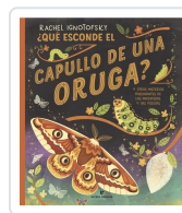
¿Qué esconde el capullo de una oruga? Ignofsky, Rachel