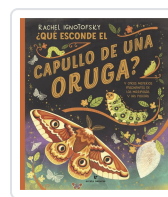
¿Qué esconde el capullo de una oruga? Ignotofsky, Rachel