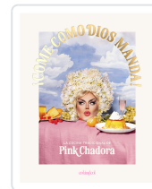
¡Come como Dios manda! Pink Chadora