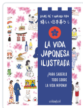
La vie japonaise illustrée Laure Kié