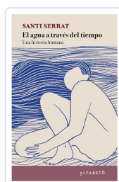
El agua a través del tiempo Serrat, Santi