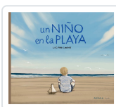
Un niño en la playa Lozano, Luciano