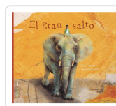
El gran salto Parera, Núria