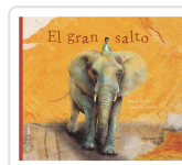
El gran salto Parera, Núria